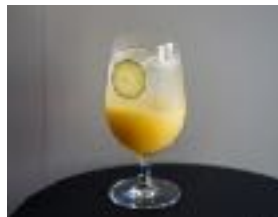
HAKKOスダチーナ ¥ 500 (税別)