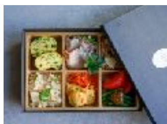
幕の内BENTO (10個から) ¥ 2,000 (税別)