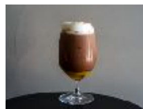
ソルティオレンジココア ¥ 600 (税別) 豆乳+50円