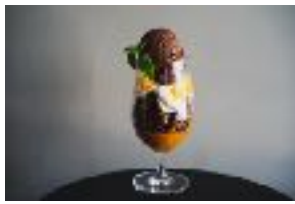
#だだっ子パフェ ¥ 1,100 (税別)