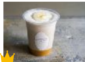
King of スムージー ¥ 600 (税別) 豆乳+50円