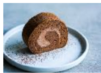
お米のチョコレート1本18cm ¥ 1,600 (税別)