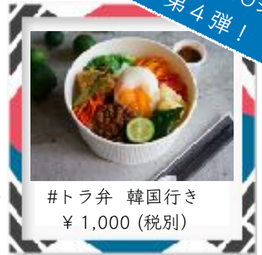
#トラ弁 韓国行き ¥ 1,000 (税別)