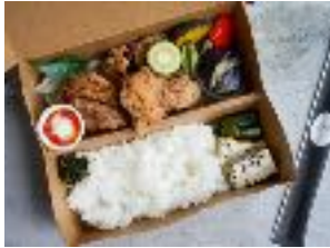
KOJI唐揚げBENTO (スイートチリ & 豆乳マヨ) ¥ 1,800 (税別) ¥ 1,100 (税別)