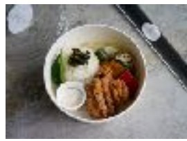
¥ 500 (税別)