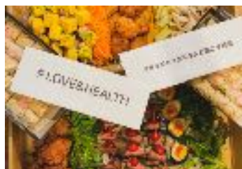
#Love&Healthケータリング ロールケーキ1本プレゼント ¥ 10,000 (税別) 4人前～