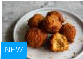
NEW おから豆乳黒糖ドーナツ ¥ 380 (税別) 6個入