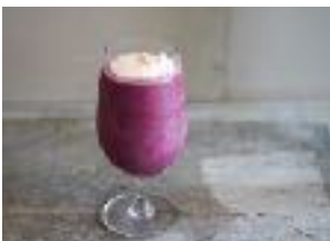
キャッツアイ ¥ 600 (税別)