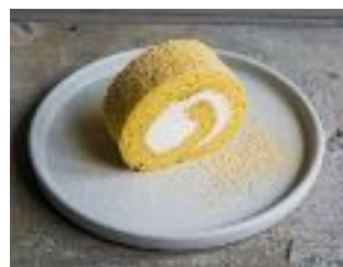
お米のロールケーキ1本18cm ¥ 1,500 (税別)