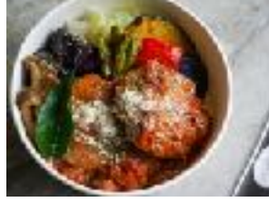
発酵トマト煮込みハンバーグ ¥ 1,200 (税別)